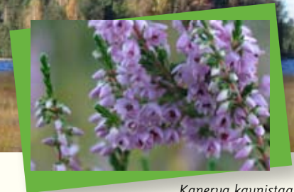
Kanerva kaunistaa karuimmat kasvuapaikat.

Ilmasto, se on kaiken takana, puhuttiinpa sitten koko maapallon mittakaavan muutoksista tai kotipuutarhan