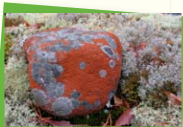
Ihan alhaalla, metsän pohjalla koristelusta vastaavat sammalet, jäkälät ja levät.